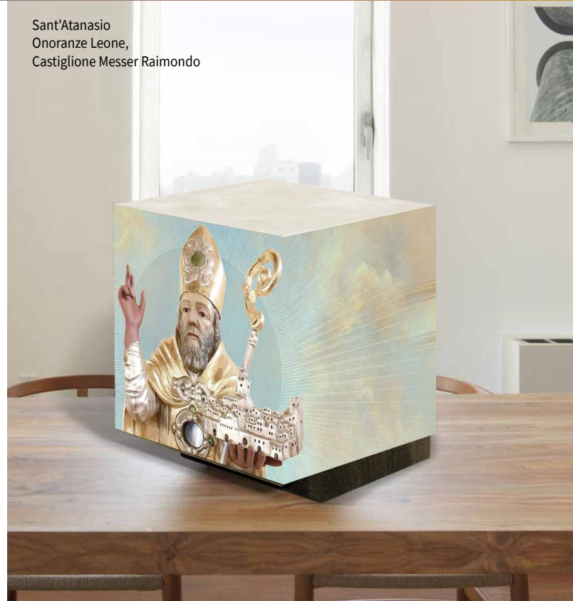
Sant'Atanasio Onoranze Leone, Castiglione Messer Raimondo