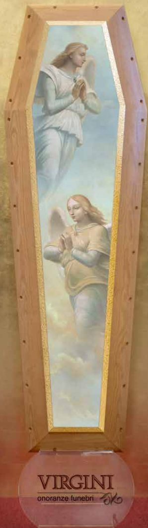
Affresco Top "Angeli" spallata, tonalità miele