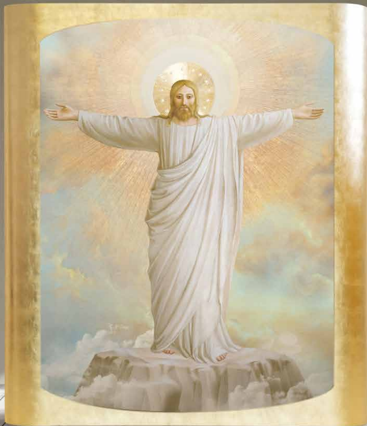
Espandibile 205 “Cristo Redentore”, foglia oro giallo