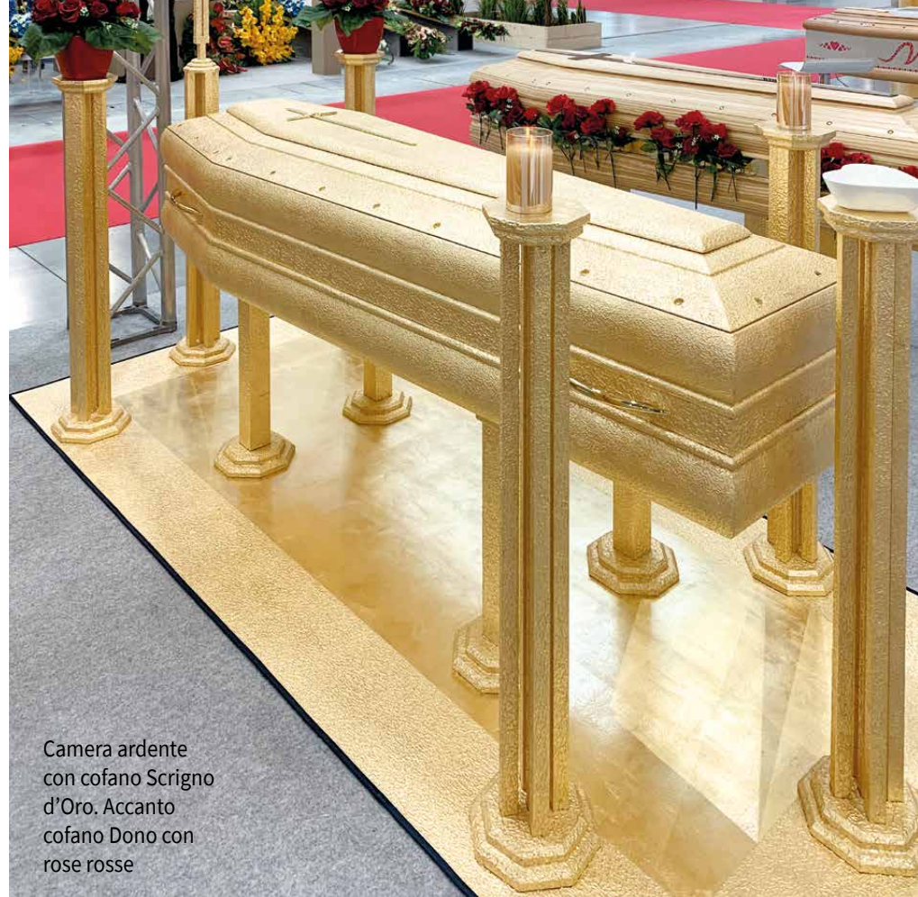
Camera ardente con cofano Scrinjo d'Oro. Accanto cofano Dono con rose rosse