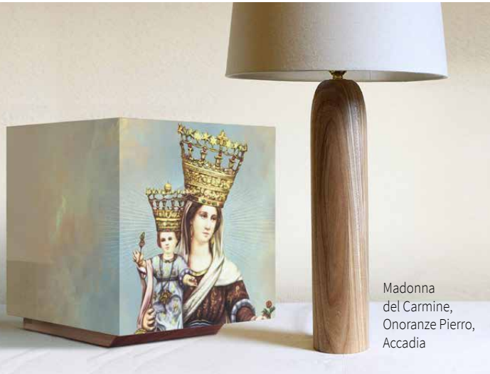
Madonna del Carmine, Onoranze Pierro, Accadia

Possiamo riprodurre qualsiasi soggetto, dalle tradizionali immagini sacre alle fotografie degli affetti più cari.