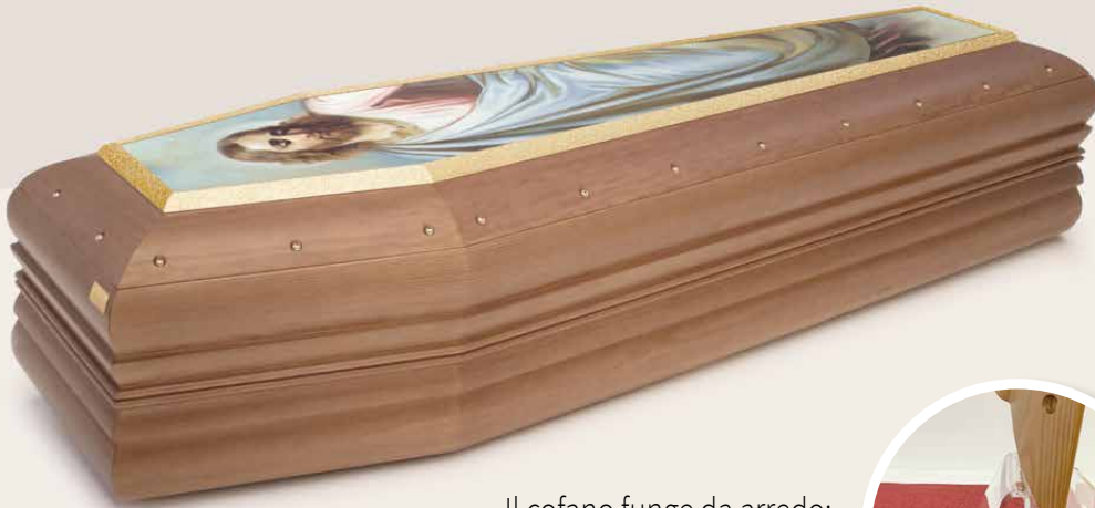
Affresco Top "Cristo ascensione" spallata, tonalità noce

Il cofano funge da arredo: il suo coperchio poggia su uno speciale pedistallo in plexiglass