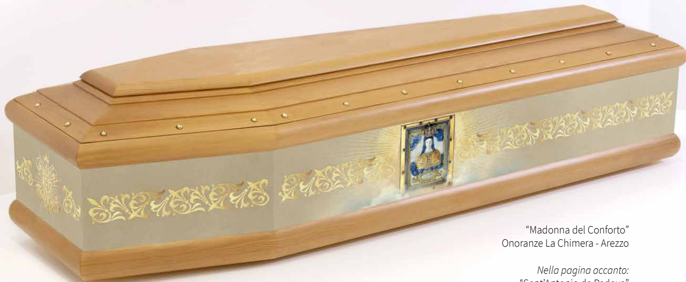
“Madonna del Conforto” Onoranze La Chimera - Arezzo

Realizziamo su richiesta soggetti religiosi e laici: la tua impresa offrirà così UN PRODOTTO UNICO!