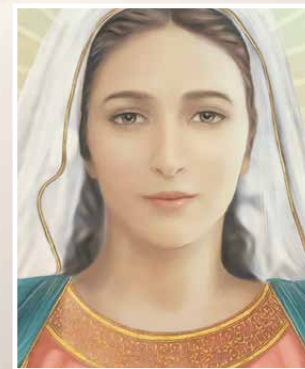
MARIA MEDIATRICE classic spallata tonalità noce

Spediamo anche un singolo cofano Affresco!