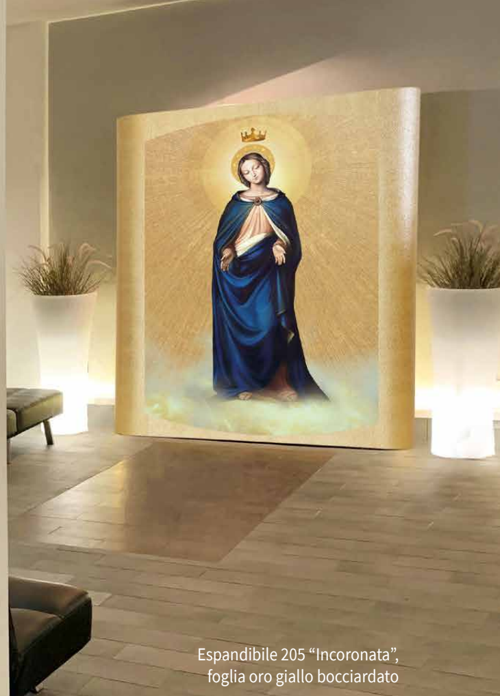
Espandibile 205 "Incoronata", foggia oro giallo bocciardato