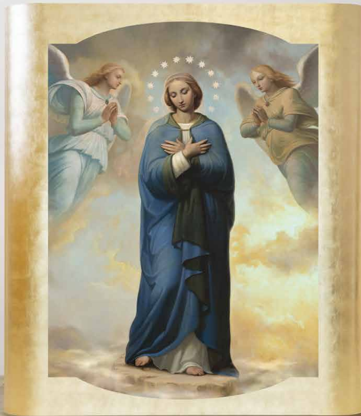
Espandibile 205 "Immacolata con Angeli", foglia oro giallo

Vuoi vincere la concorrenza? Scegli Prima Bottega