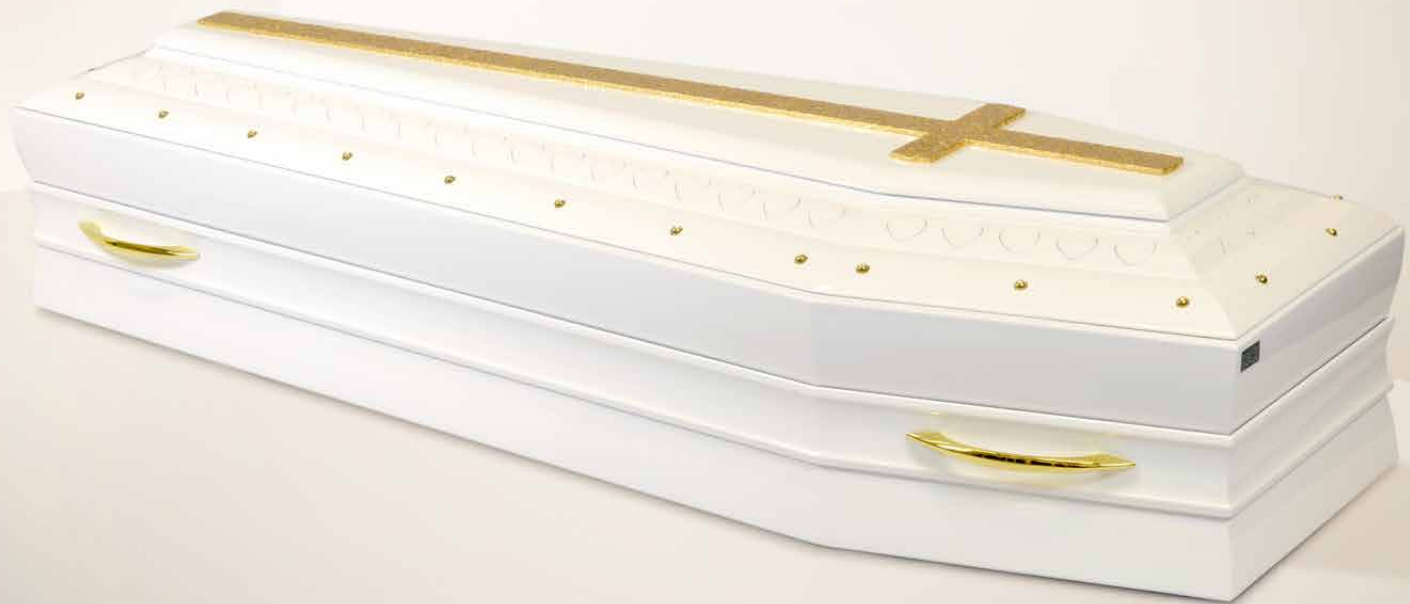
SCRIGNO DEL CUORE spallata, laccata bianca con maniglie e croce in foglia oro

Spediamo anche un singolo cofano Scrigno del Cuore!