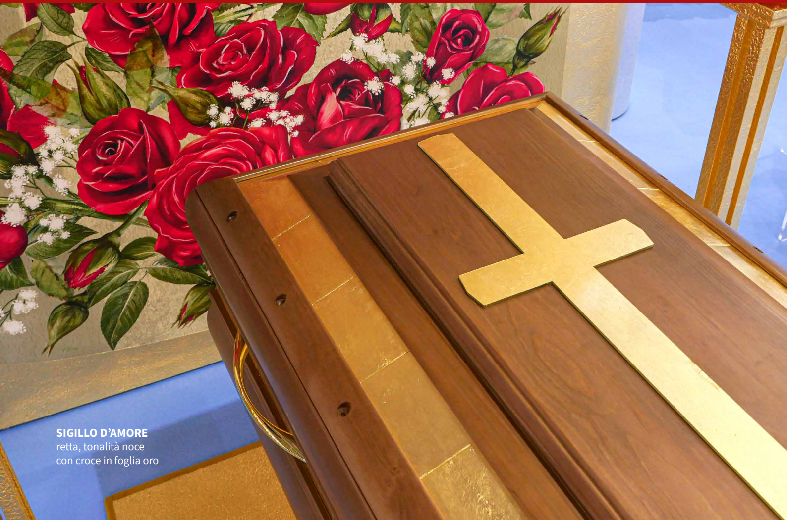
SIGILLO D'AMORE retta, tonalità noce con croce in foglia oro

Spediamo anche un singolo cofano Sigillo d'Amore!