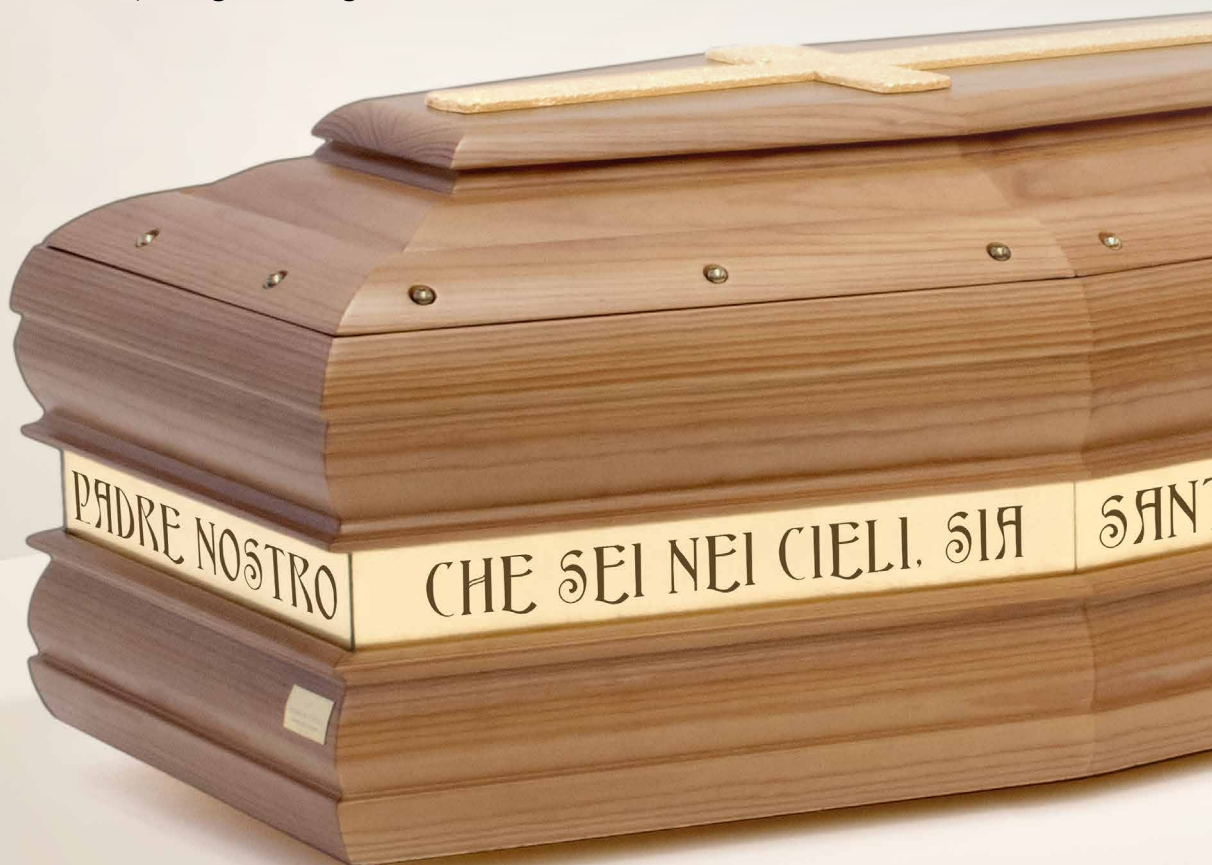
PREGHIERA • "Padre nostro", spallata, tonalità noce con croce in foglia oro

Il testo è impreziosito da uno sfondo in foglia oro e protetto da una teca in plexiglass originale.