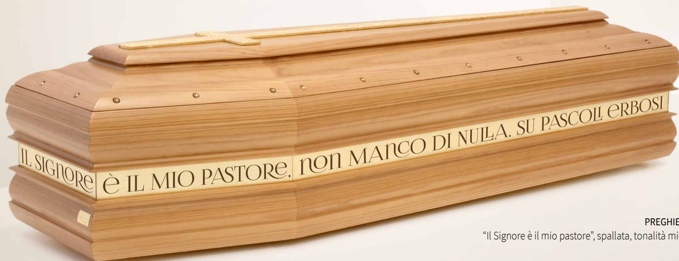
PREGHIERA "Il Signore è il mio pastore", spallata, tonalità miele

Il testo è impreziosito da uno sfondo in foglia oro e protetto da una teca in plexiglass originale.