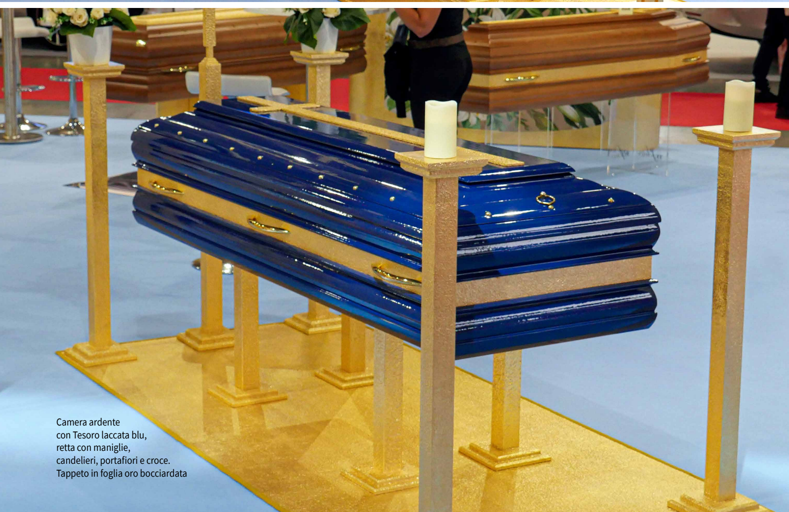
Camera ardente con Tesoro laccata blu, retta con maniglie, candelieri, portafiori e croce. Tappeto in foglia oro bocciardata