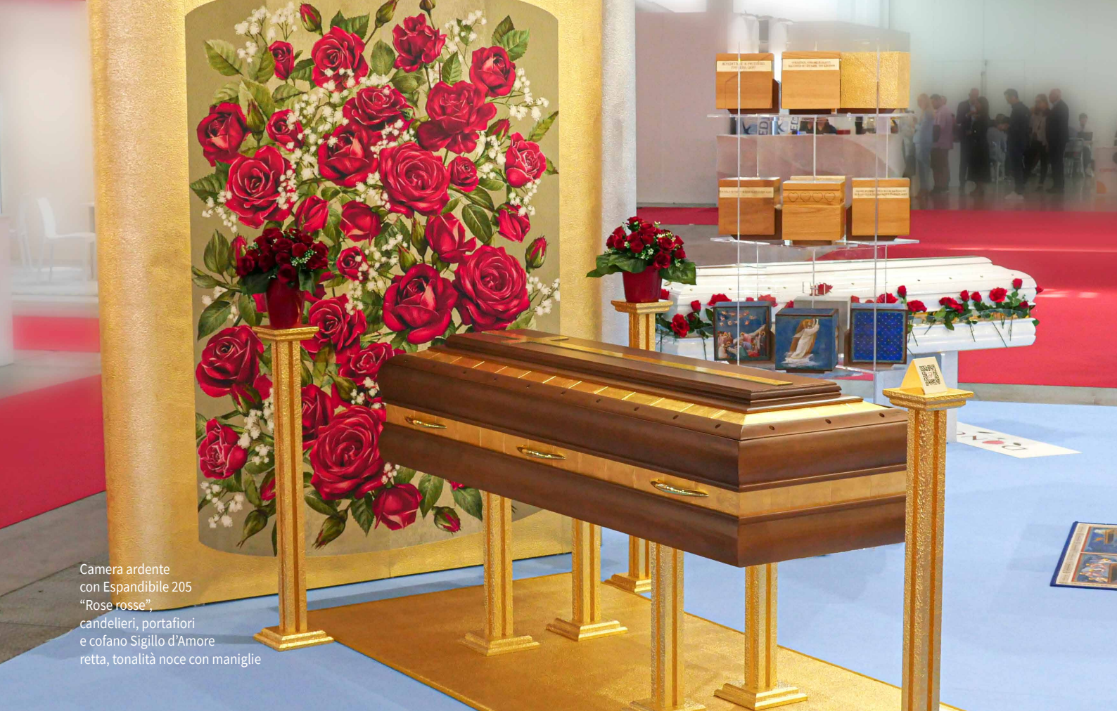
Camera ardente con Espandibile 205 "Rose rosse", candelieri, portafiori e cofano Sigillo d'Amore retta, tonalità noce con maniglie