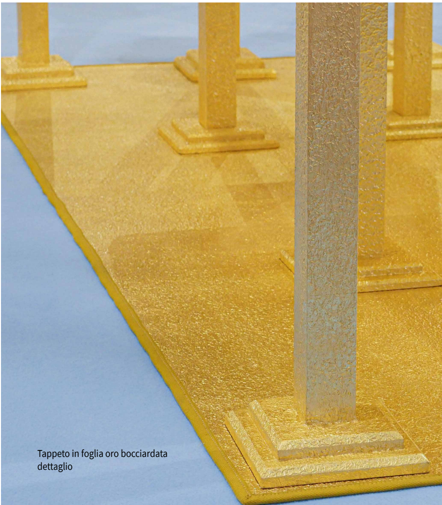
Tappeto in foglia oro bocciardata dettaglio