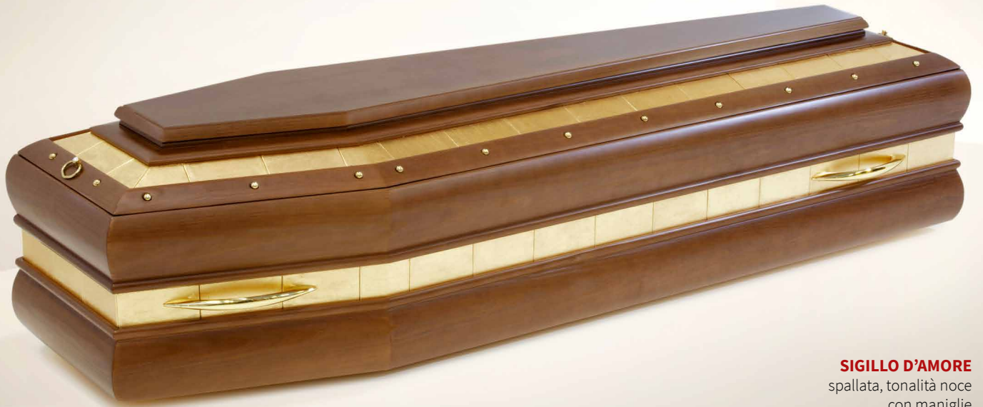
SIGILLO D'AMORE spallata, tonalità noce con maniglie

Per lasciare messaggi e pensieri d'addio che rimarranno per sempre incisi, rendendo la cerimonia unica e partecipativa.