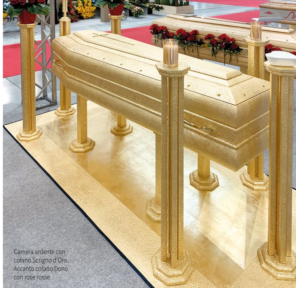
Camera ardente con cofano Scigno d'Oro. Accanto cofano Dono con rose rosse