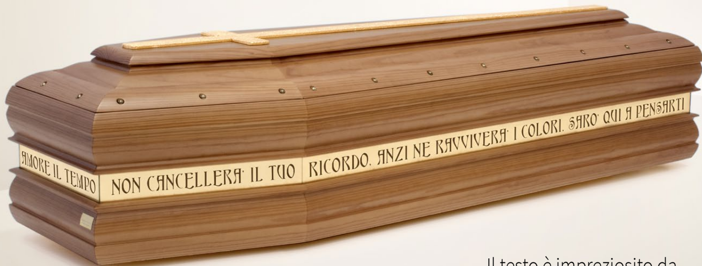
PREGHIERA "Amore" spallata, tonalità noce con croce in foglia oro

È possibile anche ordinare un pensiero dedicato (Mamma, Papà, Amore...) o qualsiasi testo si desideri.