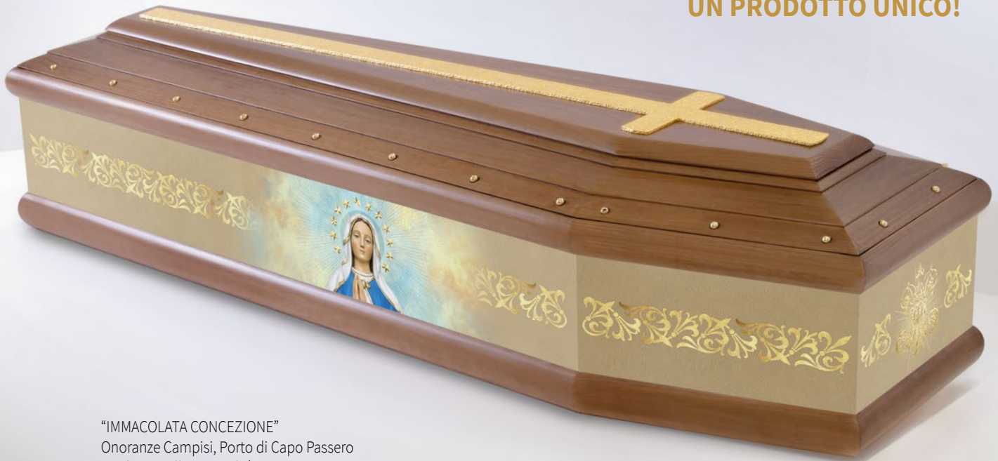
“IMMACOLATA CONCEZIONE” Onoranze Campisi, Porto di Capo Passero modern spallata, tonalità noce

Realizziamo su richiesta soggetti religiosi e laici: la tua impresa offrirà così UN PRODOTTO UNICO!