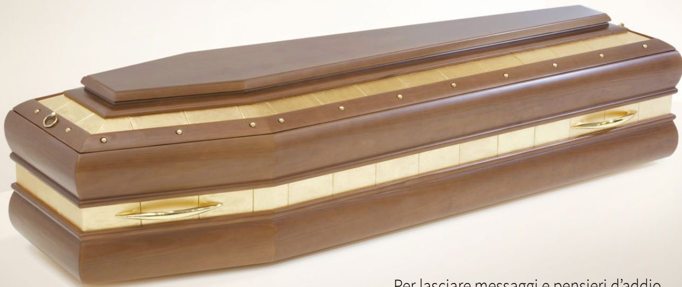
Sigillo d'Amore spallata, tonalità noce con maniglie

Due anelli in metallo da cesello e foglia oro, formati da mattonelle da incidere facilmente, anche con una penna, avvolgono e illuminano Sigillo d'Amore.